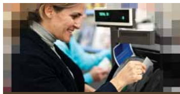
ПРОДАЖБА НА ДРЕБНО